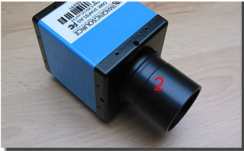
2) 1.25" Standard-Steckhülse