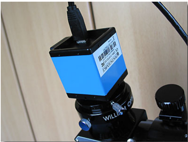
Anschluss ans Teleskop über 1.25" Steckhülse