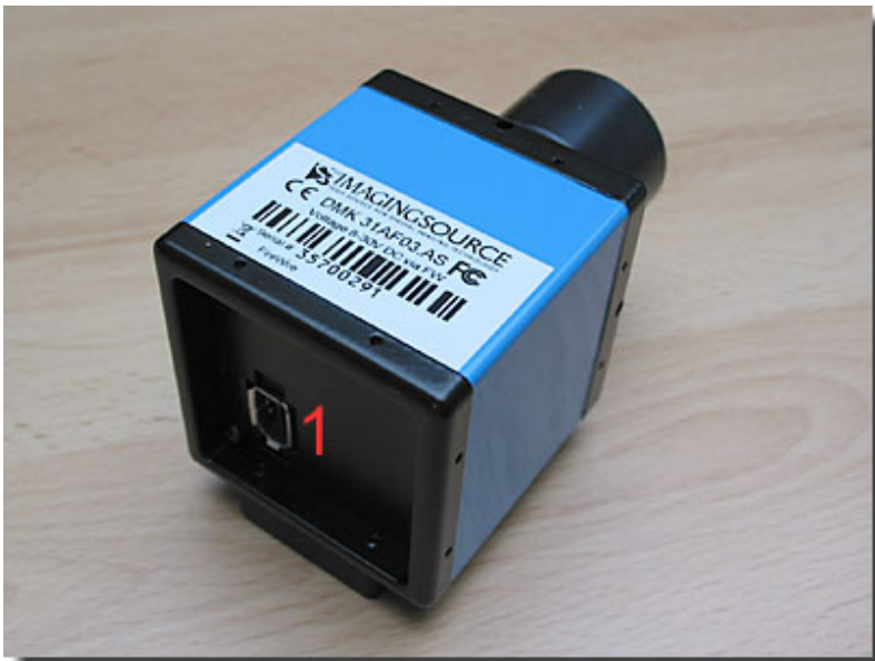
DMK31AF03.AS s/w Industriekamera 1) IEEE 1394 FireWire Anschlussbuchse (6-pol)

Die Treiberinstallation verlief problemlos und die Capture Software ist sehr umfangreich aber dennoch einfach, komfortabel und intuitiv zu bedienen. Es stehen ein Video-Mode und ein Einzelfoto-Mode zur Verfügung, welche jeweils automatisiert werden können (programmierbare Anzahl an AVI-Frames, Zeitprogrammierung, Bilderserien usw.)